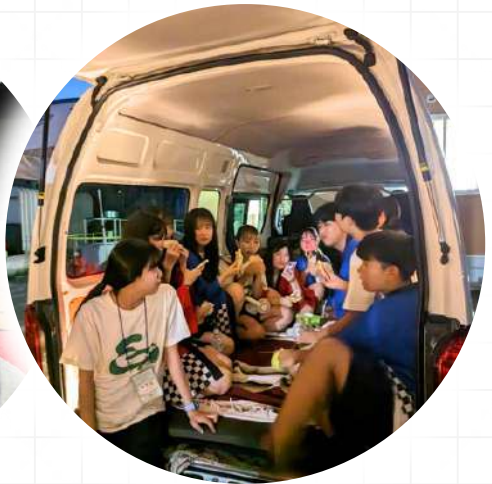
アウトリーチ (地域)