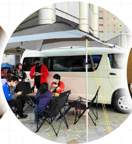
アウトリーチ (学校)